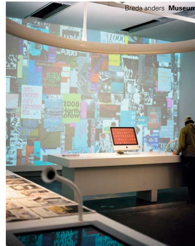
Breda anders Museum

Voor een goede kennismaking met grafisch ontwerp duikt u ondergronds, want daar vindt u de permanente expositie '100 years of Dutch Graphic Design'. Die bestaat uit drie ruimtes waar je de hele geschiedenis van het Nederlandse grafisch ontwerp in een notendop kunt bekijken. Van het ontstaan van het vak in het begin van de twintigste eeuw tot nu. De eerste zaal is het beste te omschrijven als een nostalgische trip down memory lane. Ook al zullen de meeste bezoekers niet in die vooroorlogse periode zijn opgegroeid, velen kennen nog wel de posters van de Delftsche Slaolie, Van Nelle en de Bijenkorf. Pas echt weemoedig word je wanneer je de volgende zaal binnenstapt. Je stuit eerst op de prachtige ontwerpen van onze aloude guldenbiljetten en krijgt meteen heimwee naar de Vuurtoren, de Snip en de Zonnebloem. Geen twijfel mogelijk: die euro's, hoe handig ook, halen het niet bij deze tijdloze ontwerpen. Verder vindt u in deze ruimte andere herkenbare grafische ontwerpen: van de vertrekstaten op treinstations tot pictogrammen en de Albert Heijn-huisstijl.