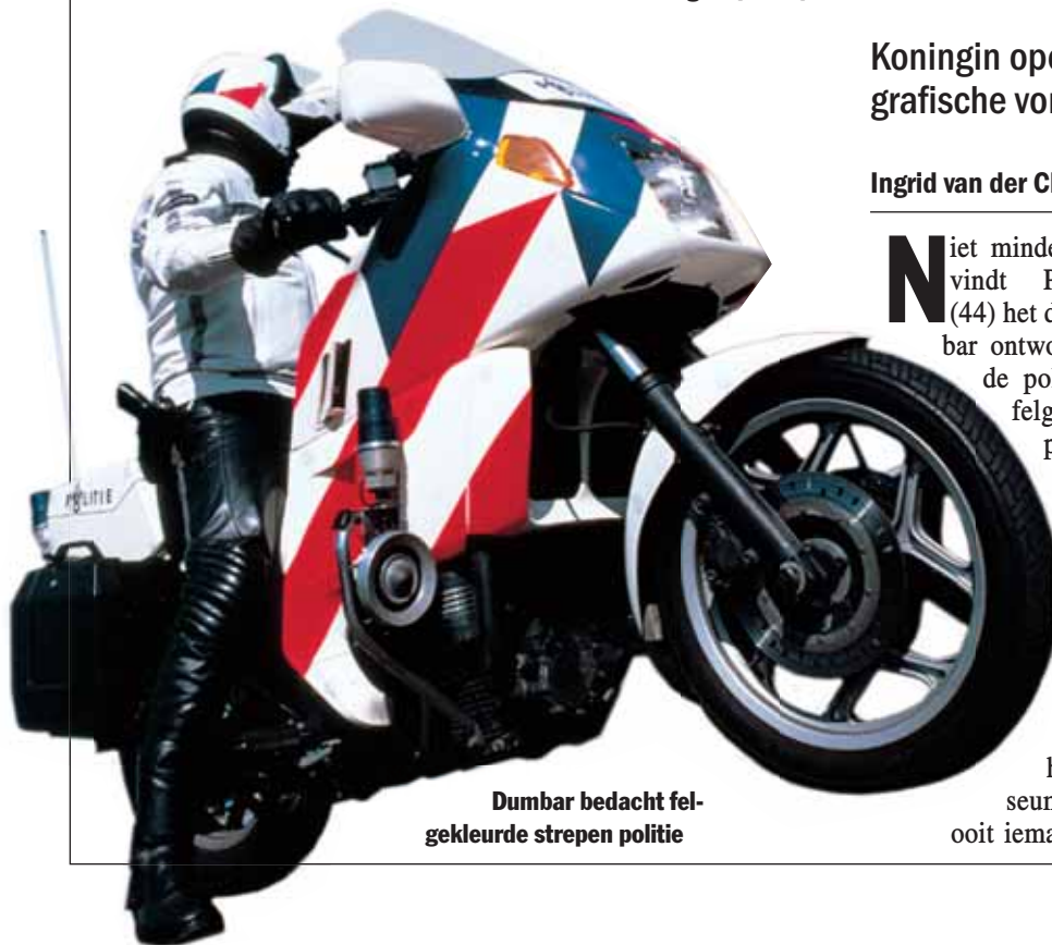
Dumbar bedacht felgekleurde strepen politie

Eindelijk krijgt Dumbar, ook verantwoordelijk voor het logo van de Nederlandse Spoorwegen, de eer die hem toekomt. Zijn ontwerp voor de politie is opgenomen in de tentoonstelling 100 jaar grafische vormgeving in Nederland van het Graphic Design Museum, gevestigd in een historisch pand in Breda. Het museum wordt op 11 juni geopend door koningin Beatrix en is het eerste ter wereld dat zich specifiek op vormgeving richt. Rijntjes: 'Grafische vorm-