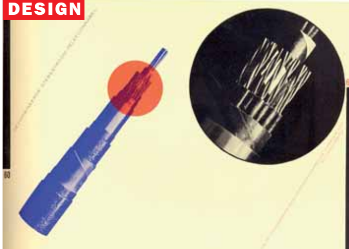
Ontwerp Piet Zwart voor catalogus Nederlandsche Kabelfabriek (1926)