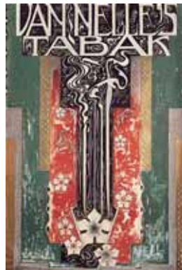
Affiche Van Nelle Tabak door Jac. Jongert (1920)