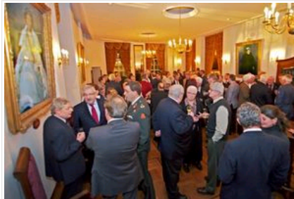
NAC, Mannenkoor, de Opera, de Spanjaardsgatconcerten en de BCV: op de borrel van de gouverneur van de KMA kom je ze allemaal tegen.

Het moderne netwerken beperkt zich meer tot de vrijdagavonden of de thuiswedstrijden van NAC, weet Jenny Koelewein van Inspire in de Veemarktstraat. Het netwerken begint hier iedere vrijdag om 9.00 uur tijdens de Open Coffee. Een stamtafel vol met zo'n twintig ondernemers. Ook voor de horeca is het netwerken interessant.