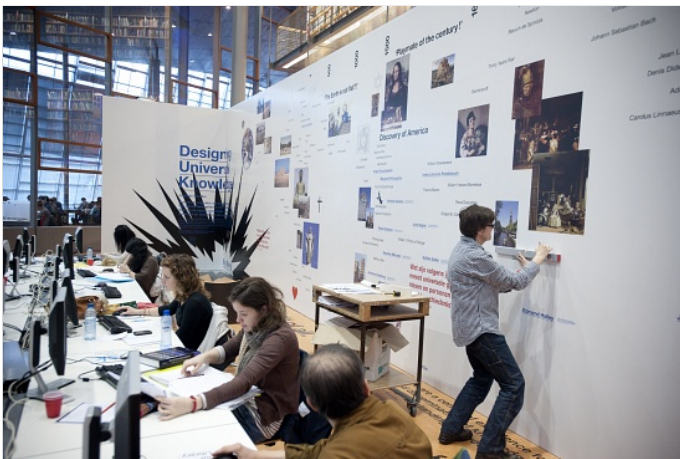
De 26 meter lange tijdlijn in de bieb moet de universele kennis van de geschiedenis weergeven, maar mag met een dikke stift gepersonaliseerd worden.

Van de oerknal tot de dood van Osama Bin Laden in 26 meter. Kunstenaar Gerlinde Schuller gaat in haar kunstwerk 'Designing Universal Knowledge' in de TU Library met zevenmijlslaarzen door de geschiedenis. En iedereen mag zijn eigen hoogtepunten toevoegen.