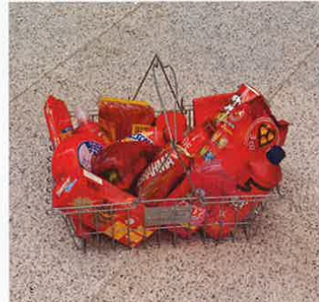
'Boodschappenmandjes' op de tentoonstelling 'SupemArt' (11 december 2011 t/m 1 april 2012).

het is geworden, wat de geschiedenis en betekenis is van beeldcultuur.' Sinds internet zijn intrede deed, is er sprake van een explosieve toename van media. De actuele beeldcultuur is bij uitstek iets van de 21ste eeuw. Een museum voor beeldcultuur past dus veel beter in de tijd waarin disciplines versmelten en beeld een onlosmakelijk onderdeel uitmaakt van ons dagelijks leven. 'We zijn beeldlezers geworden; de mens ziet meer beeld in een dag dan iemand uit de middeleeuwen in zijn hele leven. Alles is beeld. Van YouTube-filmpjes tot games tot modeprints', meent de directeur. 'Beeld is gedemocrateerd; het is van iedereen en niet meer alleen van kunstenaars en designers.'