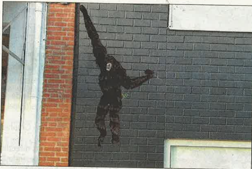
Bibliotheekmuur aan de Oude Vest.