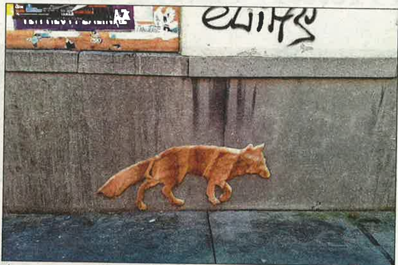
Vosje op de gevel van het voormalige klooster in de Nieuwstraat.

Neozoon , vertelt ze, is een naam die verwijst naar wat het collectief doet. „Het slaat op dieren die uit hun eigen natuurlijke omgeving op een andere plek terecht komen en zich daar voor altijd vestigen.