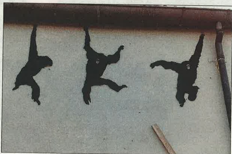
Apen aan de dakgoot van de Stadsgalerij.

Zoals ratten bijvoorbeeld. Die komen eigenlijk uit India, toch? Nou ja, in elk geval voelen ze zich inmiddels overal thuis.”