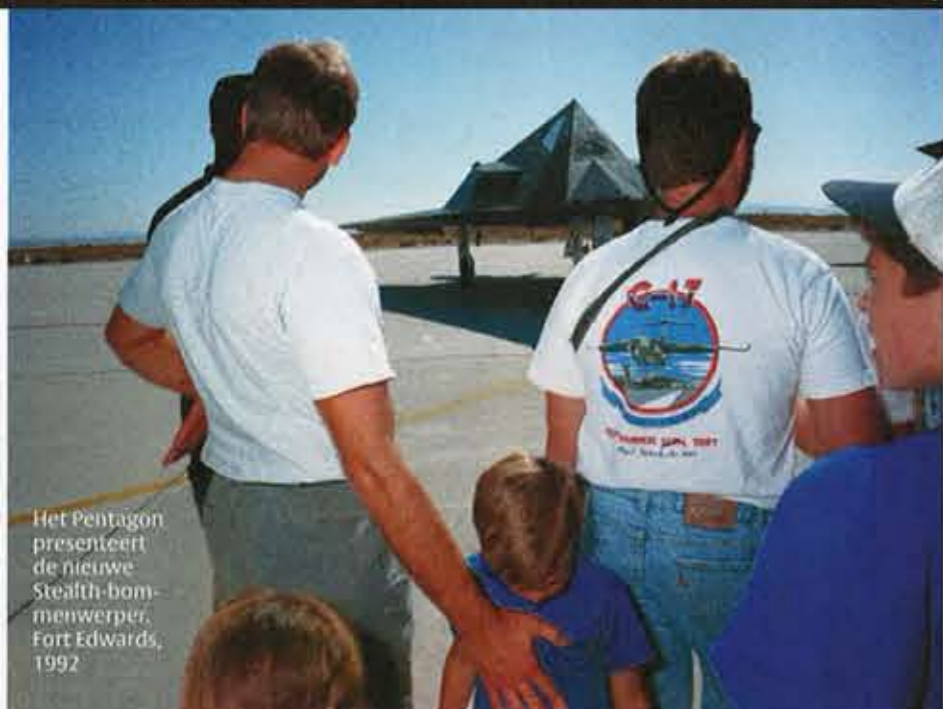
Het Pentagon presenteert de nieuwe Stealth-bommenwerper, Fort Edwards, 1992