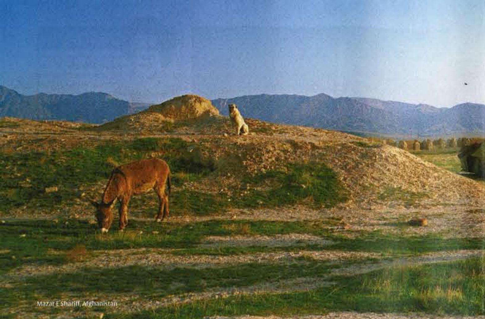
Mazar E Shariff, Afghanistan