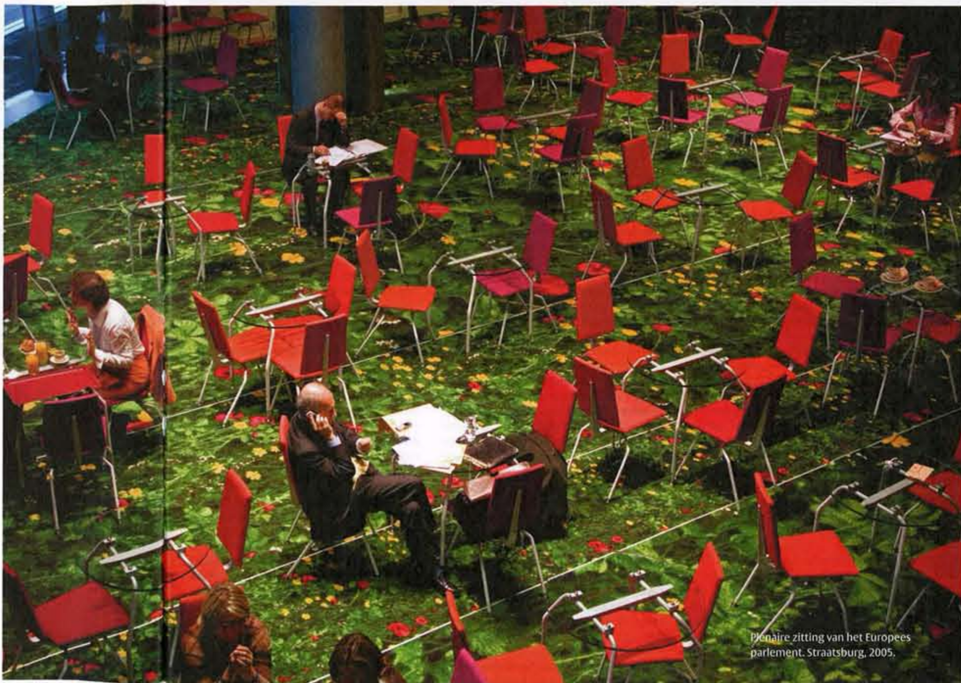
Plenaire zitting van het Europees parlement, Straatsburg, 2005.

'Het is niet voldoende om de krant te lezen en vervolgens kritisch op de islam te reageren'