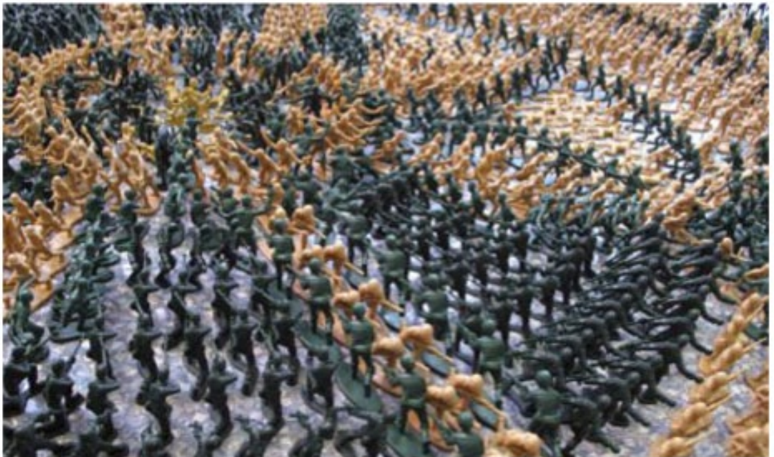
Plastic speelgoed in plaats van wol als materiaal / 3 juni 2011

Een ander recent project is een traptapijt van paperclips in een studio op het Amsterdamse NDSM-werf.