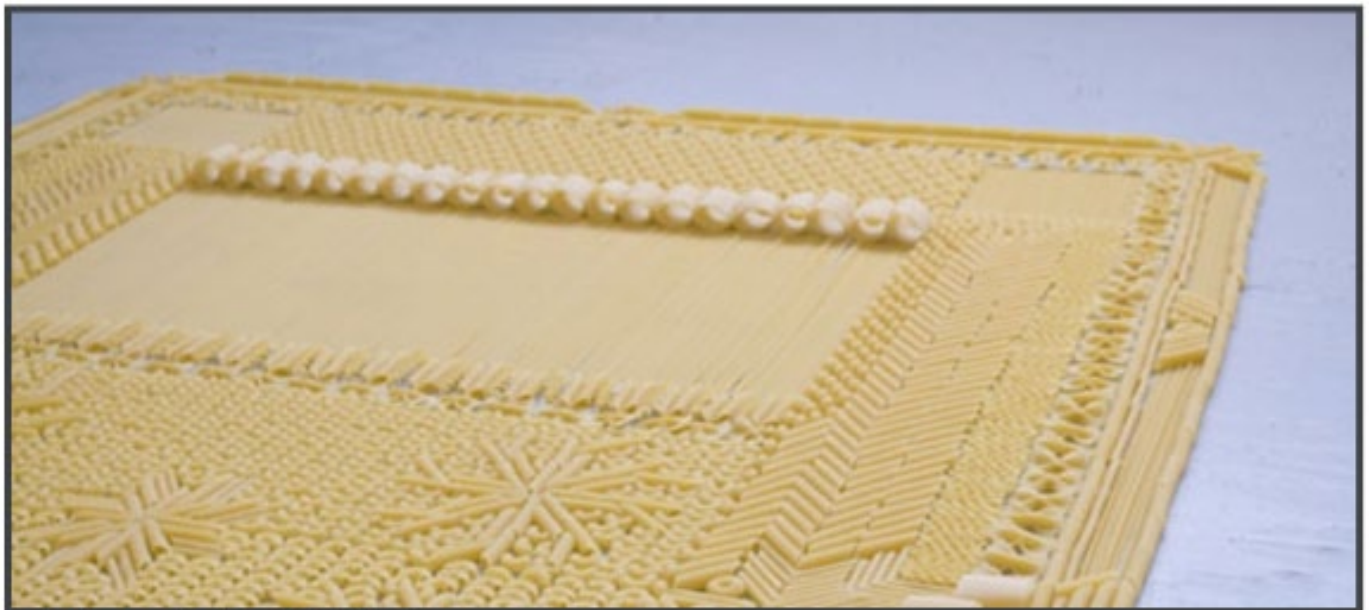
Een tapijt van pasta / 3 juni 2011 - 13:00