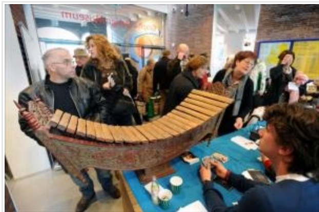
Drukte bij de ingang van het Graphic Design Museum. Bezoekers melden zich met allerlei voorwerpen bij de ontvangsttafel.

Zoals elders in het land dook in Breda veel kitsch op, maar ook flink wat kunst. Om half een 's middags waren er al zes hoofdtafelonderwerpen ontdekt. Een daarvan